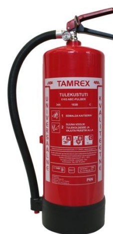
Pilt 1 6 kg pulberkustuti

NB! Pulberkustutit võib kasutada kuni 1000V pingega elektrijuhtmete ja -seadmete tulekahjude kustutamiseks.