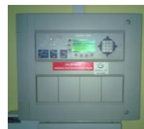
Pilt 3 ATS keskseade

ATS süsteemi tuleb regulaarselt kontrollida ja hooldada. Kontrolli ja hoolduse teostused märgitakse päevikusse. Päevikut täidavad nii kasutaja kui ka hooldusfirma. Köikidest häiretest ja rikest tuleb teha sissekanne päevikusse. Sissekandest peab selguma, mis oli häire või rikke põhjus ja mis võeti ette.