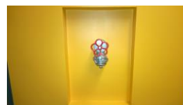
Pilt 2.2 Tuletõrjevee kraan