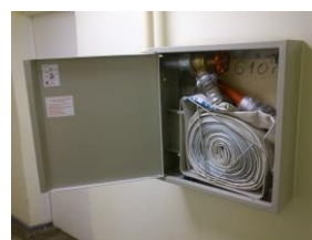
Pilt 2 Tuletõrje voolikusüsteemi kapp

Tuletõrje voolikusüsteemi tuleb regulaarselt vaadelda, kontrollida ja hooldada. Vaatluste, kontrolli ja hoolduse kohta tuleb pidada päevikut.