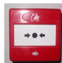
Pilt 5 Tulekahju teatenupp