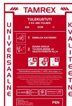
Pilt 1.2 pulberkustuti pealdis

Tulekustuteid tuleb regulaarselt vaadelda, kontrollida ja vajadusel hooldada. Kustutite vaatluste, kontrolli ja hoolduse kohta tuleb pidada päevikut