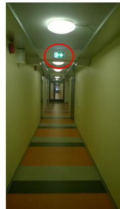
Pilt 7 Evakuatsiooni- valgustus

Turvalgusteid tuleb regulaarselt kontrollida ja hooldada . Kontrolli ja hoolduse teostused märgitakse päevikusse. Päevikut täidavad nii kasutaja kui ka hooldusfirma. Kõikidest rikestest tuleb teha sissekanne päevikusse. Sissekandest peab selguma, mis oli rikke põhjus ja mis võeti ette.