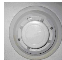
Pilt 4 Tulekahjuandur