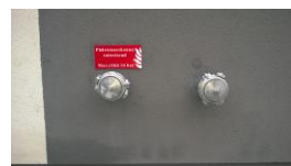
Pilt 2.3 Toitesisend