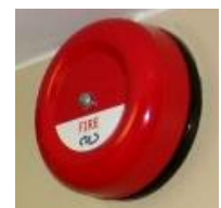
Pilt 6 Alarmseade